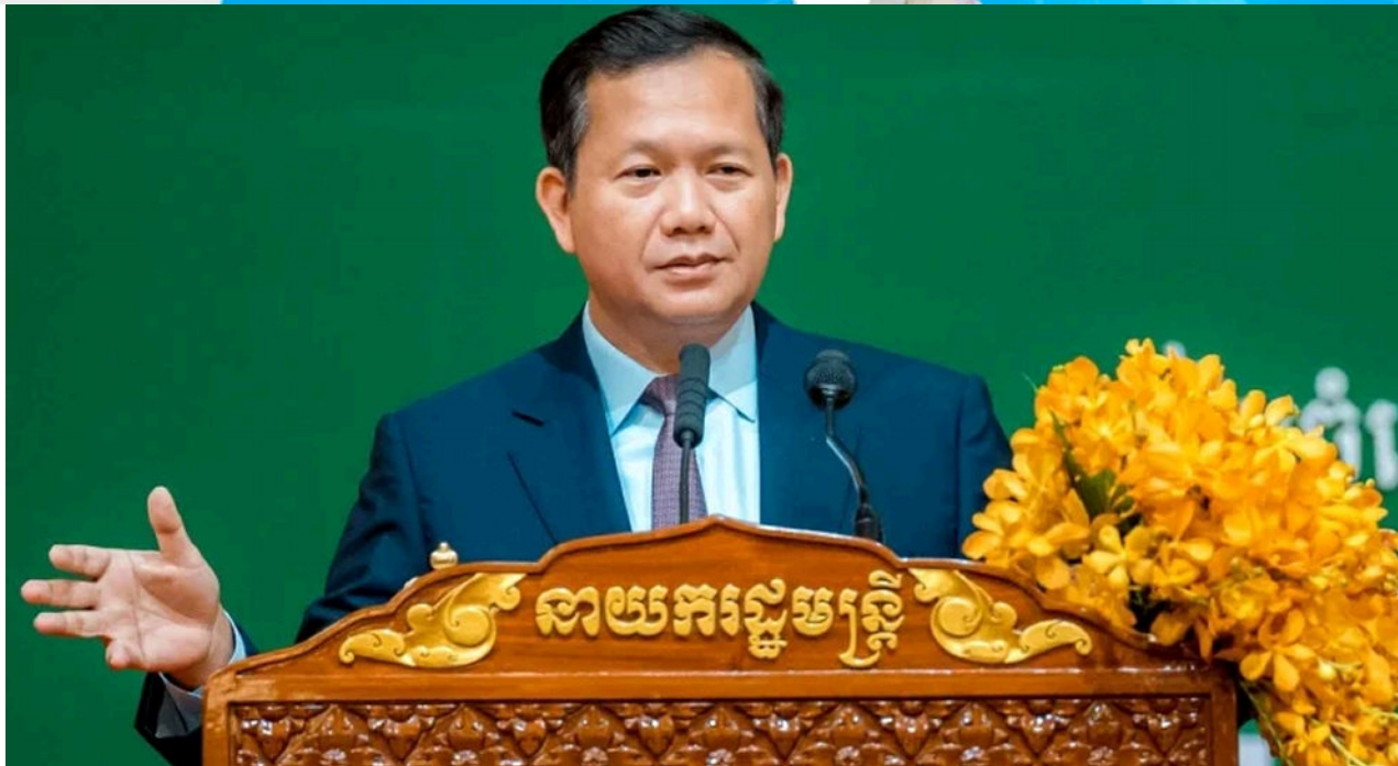
សម្តេច ហ៊ុន ម៉ាណែត ផ្តាំអ្នកស្រាវជ្រាវឱ្យចុះប្រមូលទិន្នន័យពីមូលដ្ឋានផ្ទាល់ កុំទាញពី Google

ភ្នំពេញ៖ «បើព័ត៌មានយើងប្រមូលខុស ការសម្រេចចិត្តក៏ខុស ការរៀបចំគោលនយោបាយក៏ខុស នឹងធ្វើឱ្យយើងខាតបង់ច្រើន។ ខាតពេលវេលា ខាតធនធាន ហើយអ្វីដែលសំខាន់នោះ គឺចំណុចដែលយើងចង់អន្តរាគមន៍ជួយពិតប្រាកដ គឺត្រូវបានទុកចោល។»។ នេះជាការលើកឡើងរបស់សម្តេច ហ៊ុន ម៉ាណែត ដោយផ្តាំទៅកាន់អ្នកស្រាវជ្រាវ ក្នុងការវិភាគទិន្នន័យធ្វើគោលនយោបាយអ្វីមួយ គឺត្រូវចុះប្រមូលទិន្នន័យពី