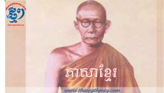
( https://thmeythmey.com/detail/55107 ;