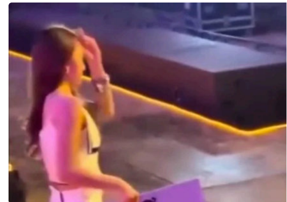
រដ្ឋមន្ត្រីមហាផ្ទៃប្រតិភូនឹងពាក្យលែបខាយលើស្ត្រីភេទរបស់ពិធីករប្រដាល់ម្នាក់ ( https://thmeythmey.com/detail/145306 ;